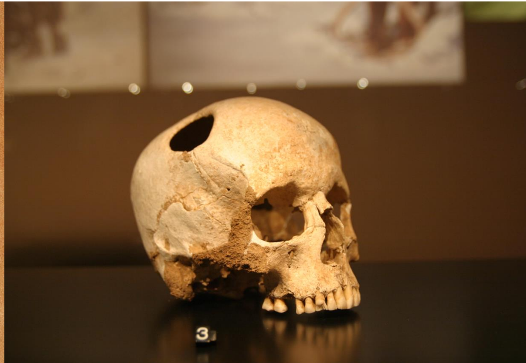
Immagini di cranio risalente al 3.000 a.C.